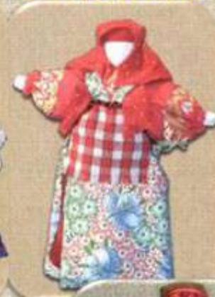
Кукла на выхвалку