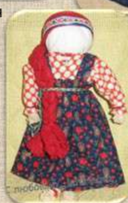
Кукла с косой