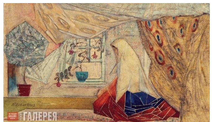
«На молитве». Бумага, акварель.