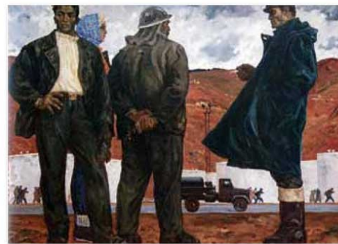
«В нефтяном крае». Холст, масло.