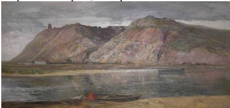
«Уфа. Шиханы». Холст, темпера, масло.