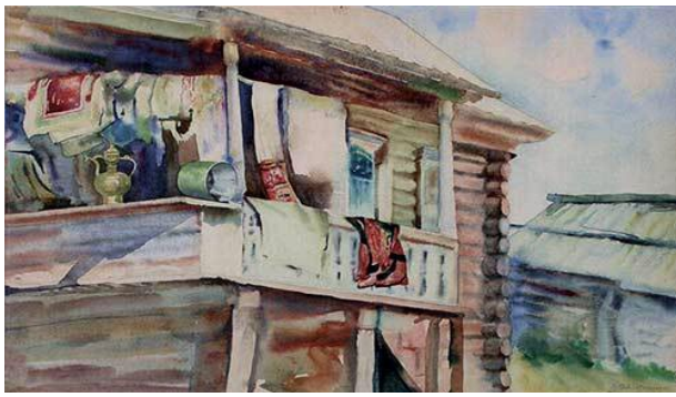
«Крыльцо башкирской избы». Бумага, акварель.