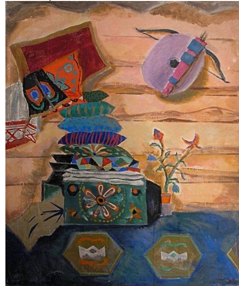
«В избе Салавата». Картон, темпера.