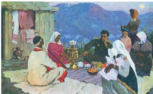
«Легенда о батыре». Холст, масло.