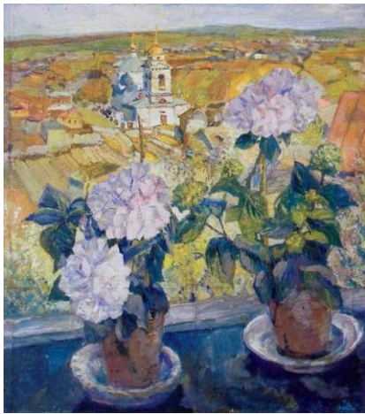
«Гортензии». Картон, темпера.